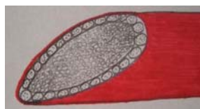
マルチ構造の概略図